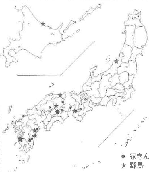
図1 令和2年度 国内における高病原性鳥インフルエンザ発生状況(令和2年12月14日時点)