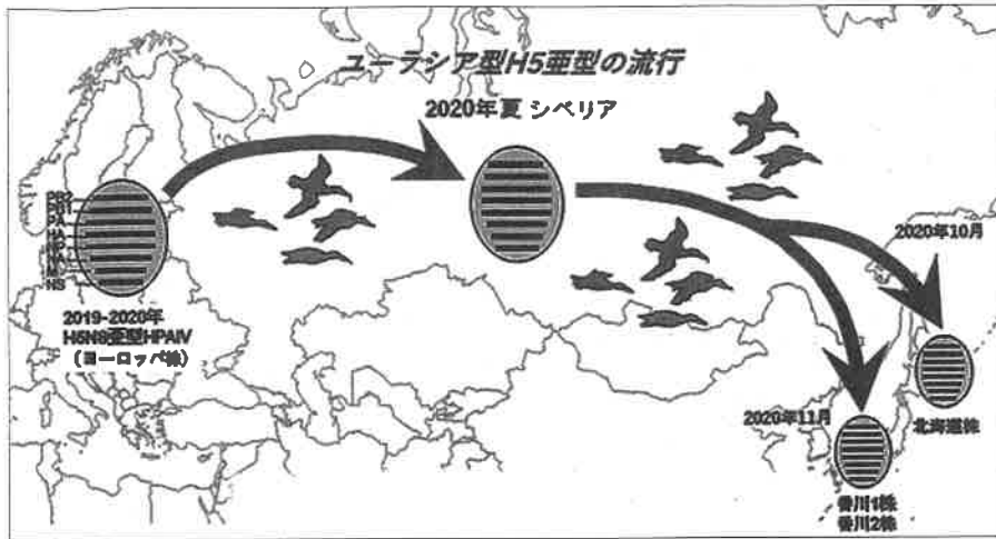
図2 ユーラシア型H5亜型の流行(農研機構動物衛生研究部門)