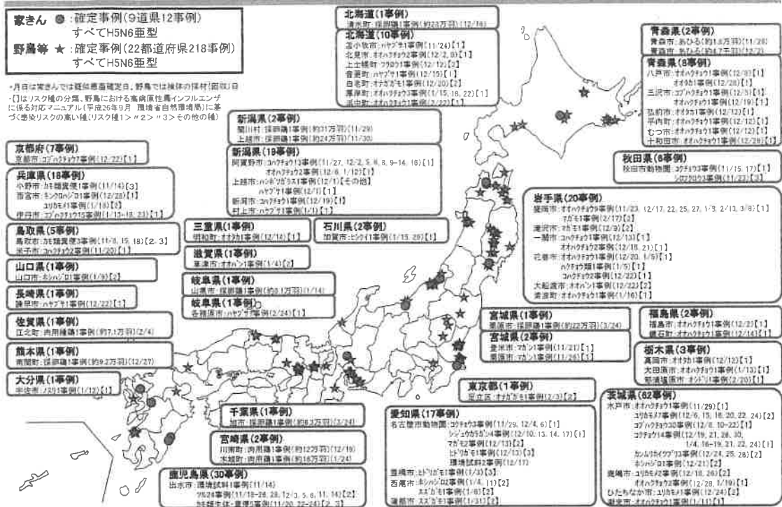
図1 2017年シーズンの野鳥および鶏でのHPAI事例