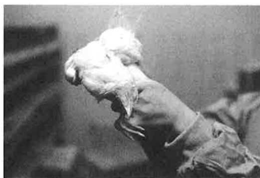
図2 アジア型ND：不全免疫雛の神経症状（頸部捻転）

七、二、一、日④回復三十〜六十日となり、定型的な事例に比較して展開が遅く経過が長くなる。そしてこの際特徴的な事象として③神経症状の発現が挙げられる。ちなみに神経症状を示す鶏病としてマレック病やボツリヌス症等がある。不全発症アジア型NDに現れる神経症状の特徴は頸部の捻転である（図2）。アメリカ型のそれが斜頸や脚弱程度である（図3）のに比べてはるかに高度で、頭を腹の下に巻き込むあるいは頭部を後ろへ反らすといった特徴的なものや間歇的に右あるいは左に旋回するもの等が目を引く。